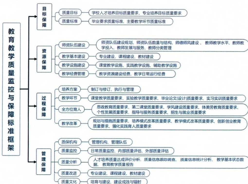
图1 教育教学质量监控与保障体系

法（试行）》等，为师德师风建设奠定了制度保障；制定印发《呼和浩特民族学院“卓越教师”岗位实施办法》《呼和浩特民族学院教职工攻读博士学位管理办法（试行）》《呼和浩特民族学院行业导师管理办法》《呼和浩特民族学院“双师型”教师队伍建设实施办法》等制度，为强化领军人才和骨干人才引进和培育奠定制度保障；修订《呼和浩特民族学院职称评审办法（试行）》，实现了按不同层次和类型进行分类分层评价；制订《呼和浩特民族学院机构设置与定编定岗实施办法》《呼和浩特民族学院专业技术岗位重点业绩分类与绩点评价参考》《呼和浩特民族学院新一轮全员岗位聘任工作实施方案》等相关规章制度，强化岗位管理，定岗定责，依岗考核，建立健全绩效考核制度；制订《呼和浩特民族学院教职工年度考核办法（试行）》，为正确评价教职工思想表现和工作实绩，提供制度保障。